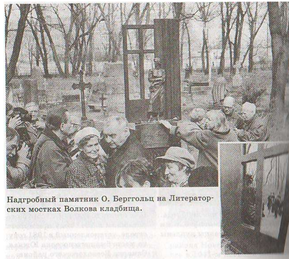
Надгробный памятник О. Берггольц на Литераторских мостках Волкова кладбища.

Еще тебе такие песни сложат, Так воспоют твой подвиг и дела, Что ты, наверно, скажешь: - Не похоже. Я проще, я угрюмее была.