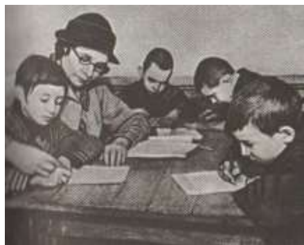
Школа в бомбоубежище