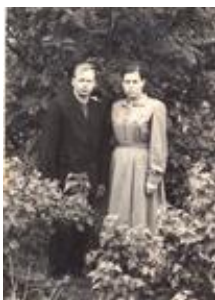
1952 год. С мужем.

В училище была производственная практика, нам выделяли делянки, которые мы должны были выкосить или сжать. Нам помогали мальчишки. Первая настоящая работа – агротехник. Один на несколько хозяйств. Руководителей - мужчин не хватало, и меня назначили председателем в колхоз «Сталинец». В 22 года. Я отказалась. У меня был маленький ребенок, к тому же я была молодая и неопытная. Какой из меня председатель? Осталась работать агротехником. Поступила в Галичский техникум, в Костромской области. Я была беременна, было тяжело ездить на учебу. После окончания техникума работала в с. Вехошижемье председателем райплана, была членом и депутатом районного совета. Меня назначили в г. Ленинград на шестимесячные курсы в Ленинградский финансовый экономический институт. От этой поездки у меня остались яркие воспоминания. Пока я там училась, поступила на заочное отделение на экономический факультет.