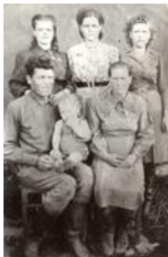
После войны. Я с родителями и сестрами. 2-я в верхнем ряду

Нас в семье было четверо детей, девочки. Брат умер в младенчестве.