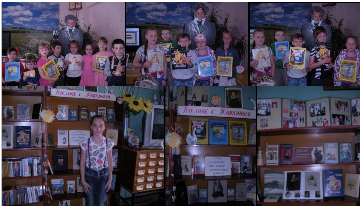
В ЦДБ оформлена выставка рисунков «Сказки Пушкина в рисунках детей».